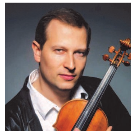
NICOLAS KOECKERT Violon - Allemagne