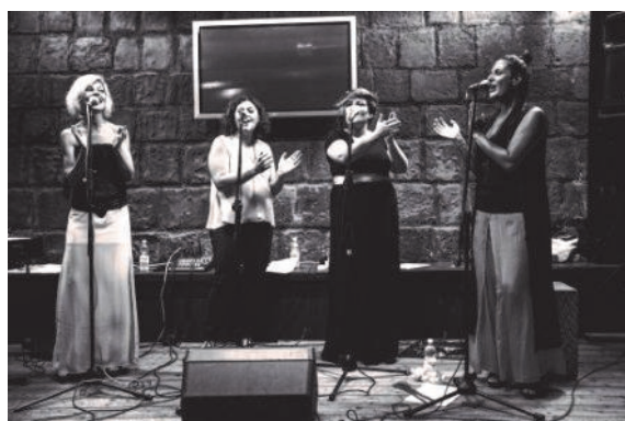
GLORIUS VOCAL QUARTET Quatuor vocal jazzy - Italie