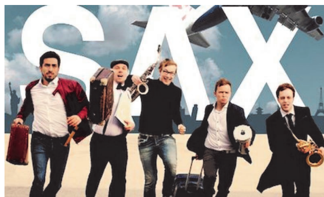
FIVE SAX Quintet de saxophones - International