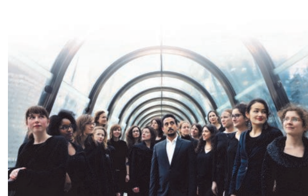
ENSEMBLE MANGATA Ensemble de voix féminines - France / Vénézuela